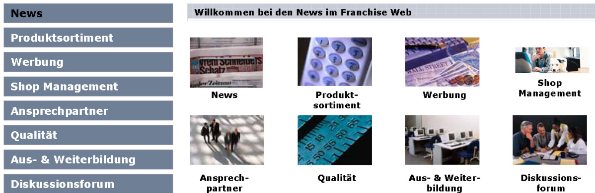
Beispiel Struktur Intranet