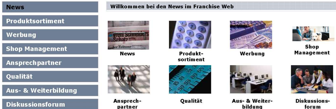
Beispiel Struktur Intranet